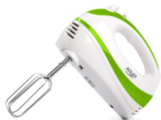
Mixer AD 4205