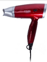
Hair Dryer AD 2220