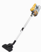
Bagless Vacuum AD 7036