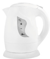
Electric Kettle AD 08